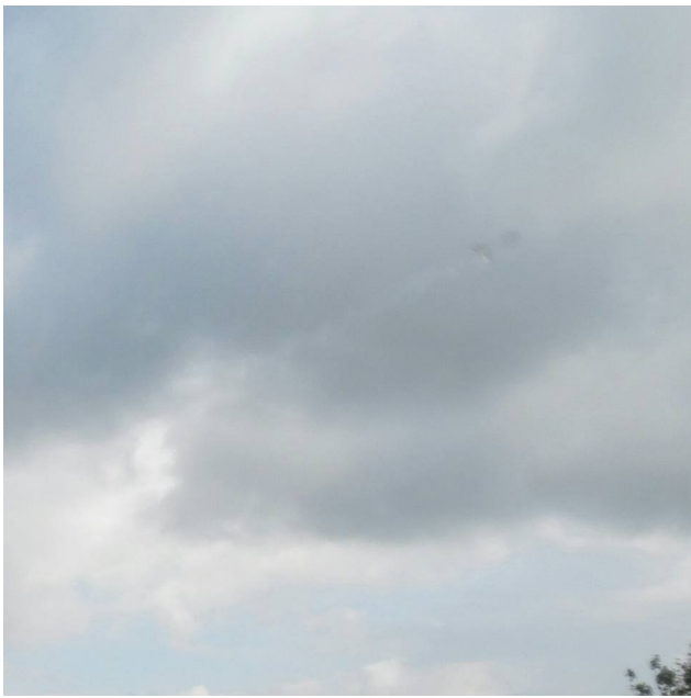
Photo 4 : une goutte d'eau poussée par le vent remonte sur la vitre.

C'est une goutte d'eau qui remonte sur la vitre à cause du vent qui fait illusion.