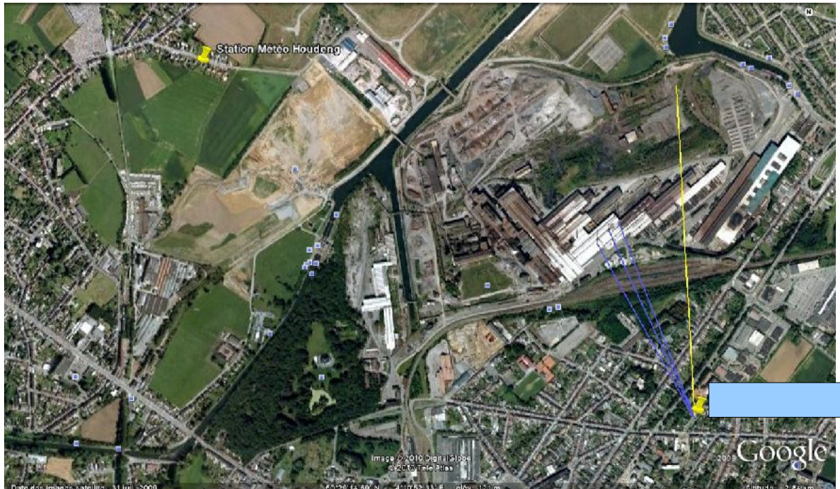
Illustration 1: en jaune la direction du phénomène observé, en bleu les directions des trois cheminées.